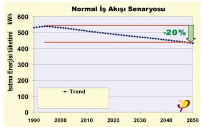
AB Isıtma Enerji İhtiyacı - Normal iş akışı durumunda

19 Mayıs 2010'da yeniden düzenlenmesi tamamlanarak AB Komisyonunca kabul edilen 2002/91/EC Binalarda Enerji Performans Direktifi 18 Haziran 2010'da AB resmi gazetesinde yayımlanmıştır. Bu düzenlemedeki en önemli değişiklik; 2019 yılından itibaren yeni inşa edilecek tüm binalardaki enerji limitlerini düşürerek neredeyse sıfır enerji tüketen pasif evler veya sıfır karbon salımlı evlerin yolunu açması ve zorunluluk getirmesidir. Yalıtım, binalardaki enerji performansını artırmaktaki en efektif yöntem olarak kabul edilmektedir.