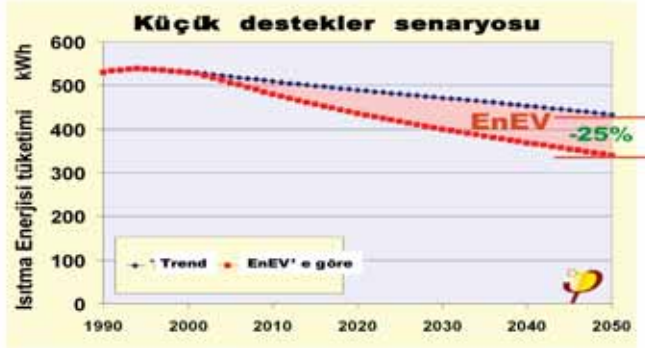
AB Isıtma Enerji İhtiyacı - Küçük destekler uygulandığı durumda

Halen yürürlükte olan tedbirler sayesinde, eğer tüm tedbirler kurallara uyumlu bir şekilde uygulanırsa, ısıtma enerji ihtiyacı, 2050 yılı itibarıyla %25 daha azalacaktır. Bu tasarrufun dahi sürdürülebilir bir gelişme için yeterli olmayacağı gibi, Avrupa'nın kendi bölgesinde halen sahip olduğu piyasa liderliğine de katkı sağlamayacaktır.