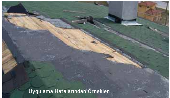
Uygulama Hatalarından Örnekler

Shingle levhaların doğru bir şekilde uygulanabilmeleri için öncelikle, sağlam ve düzgün bir altyapı gerekmektedir. Bu altyapı OSB (Oriented Strand Boards) levhalar veya su kontraplağı gibi panellerin kullanılmasıyla mümkündür.