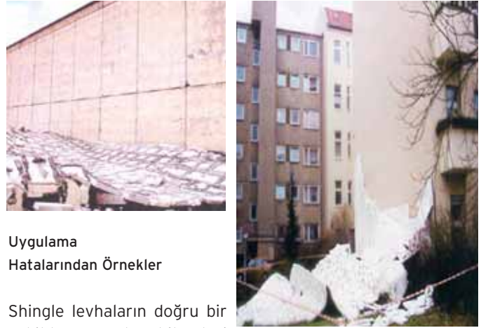
Uygulama Hatalarından Örnekler

Shingle levhaların doğru bir şekilde uygulanabilmeleri için öncelikle, sağlam ve düzgün bir altyapı gerekmektedir. Bu altyapı OSB (Oriented Strand Boards) levhalar veya su kontraplağı gibi panellerin kullanılmasıyla mümkündür.