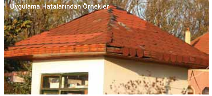
Uygulama Hatalarından Örnekler

6- İkinci kat örtünün serim yönüne 90 derece dik uygulanması hatadır. İkinci kat aynı yönde birinci katın istikametinde alttaki