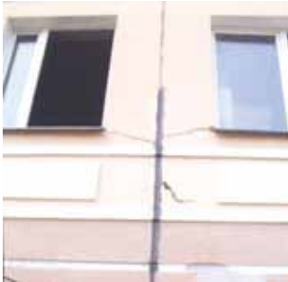
Uygulama Hatalarından Örnekler

Gerektiği halde derzler bırakılmamışsa, ısı değişimine maruz veya farklı oturma eğiliminde olan yapı elemanlarında, çeşitli gerilmeler meydana gelmektedir. Bu gerilmeler yapının sisteminde veya mevzi olarak bazı bölgelerinde çatlaklar meydana getirmektedir. Bu çatlaklar, oluşan gerilmenin düzeyine göre tahripkar ve derin olabilmekte; özellikle ince yapıda rahatsız edici bir görüntü meydana getirmektedirler.