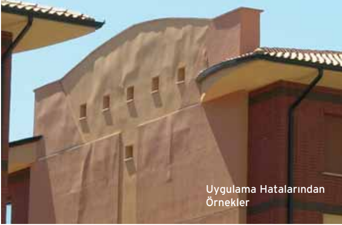
Uygulama Hatalarından Örnekler

duğu gerilmeler, parapet duvarı ile yalıtımın birleşme noktasında çatlakların oluşmasına ve bu bölgeden su girmesine ne-